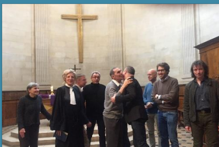
2 décembre : envoi liturgique du CCDB