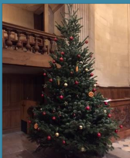
Sapin de Noël aux Billettes