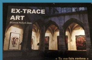
Exposition « Tu me fais revivre » Vernissage le 11/04/19