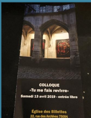
Colloque « Tu me fais revivre » le 13/04/19

Mais toi Seigneur, tu es un bouclier pour moi ; tu es ma gloire, celui qui relève ma tête.