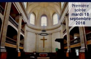
Première soirée mardi 18 septembre 2018