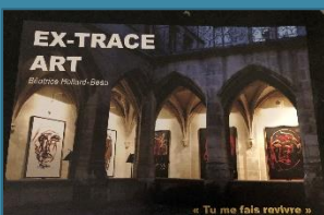
Exposition « Tu me fais revivre » Vernissage le 11/04/19