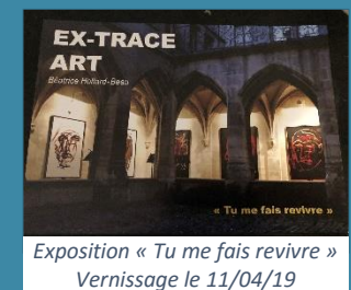
Exposition « Tu me fais revivre » Vernissage le 11/04/19