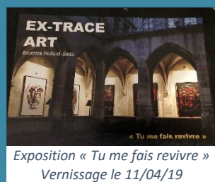
Exposition « Tu me fais revivre » Vernissage le 11/04/19