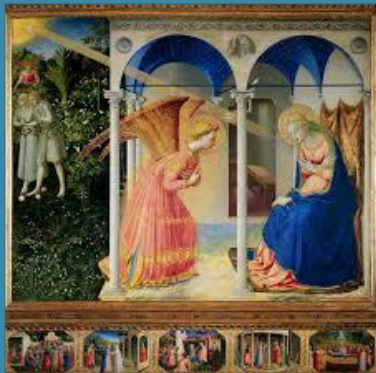
« La puissance du Très Haut te couvrira de son ombre » (Lc 1,35)