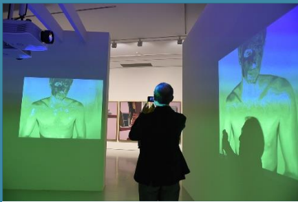
L'Au-delà du visible

Béni soit le Seigneur chaque jour ! Ce Dieu nous apporte la victoire.