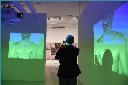
L'Au-delà du visible

Chantez pour le Seigneur un chant nouveau, car il a fait des choses étonnantes ; sa main droite et son bras saint lui ont donné la victoire.