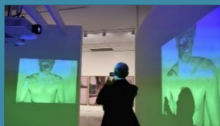
L'Au-delà du visible

Heureux l'homme qui craint le SEIGNEUR, et qui aime ses commandements.