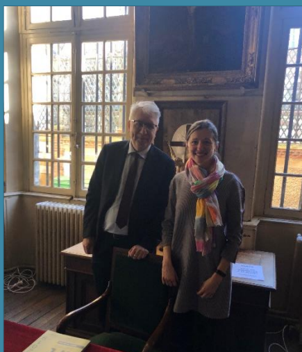
Visite le 7 février de S.E. Monsieur Imants Liegis, Ambassadeur de Lettonie en France, en vue de la commémoration des 200 ans de la cloche des Billettes / en 1820.

Les déjeuners œcuméniques du groupe EDC (Entrepreneurs et Dirigeants Chrétiens) : ils ont repris le jeudi 12 septembre (tous les 2èmes jeudis du mois). Renseignements, Jacques Chevallier : 06 08 74 00 08.