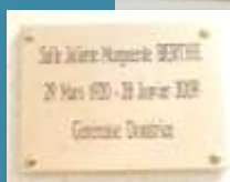
Dévoilement de la plaque en l'honneur de Juliette Berthe le 29 avril 2018