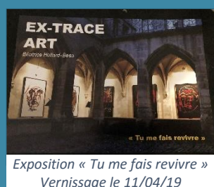
Exposition « Tu me fais revivre » Vernissage le 11/04/19