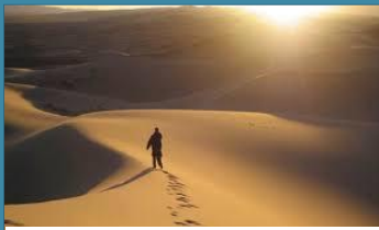
Entrée en Carême

Car ton action me réjouit SEIGNEUR ! et devant les œuvres de tes mains, je crie de joie. Que tes œuvres sont grandes, SEIGNEUR, et insondables tes desseins !