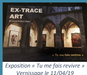
Exposition « Tu me fais revivre » Vernissage le 11/04/19