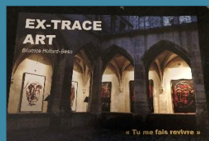
Exposition « Tu me fais revivre » Vernissage le 11/04/19