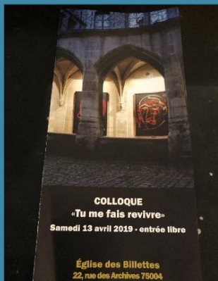
Colloque « Tu me fais revivre » le 13/04/19