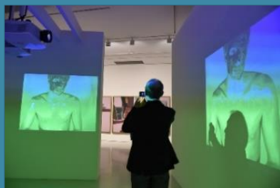
L'Au-delà du visible

Jeudi 9 janvier : Pas d'office des Vêpres en raison des travaux dans l'église des Billettes. Les offices des Vêpres reprendront après les travaux.