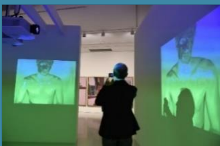
L'Au-delà du visible

Je veux réfléchir à tes exigences et regarder le chemin que tu m'indiques.